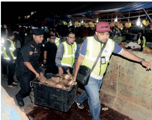
Antara barang jualan yang disita pada operasi MPS.

SELAYANG - Operasi Bersepadu Penjaja Warga Asing di hadapan NSK di sini oleh Majlis Perbandaran Selayang (MPS), kelmarin bertukar kecoh selepas terdapat pihak tidak berpuas hati dengan tindakan itu.