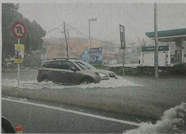
■蕉赖斯嘉镇部分道路出现积水，汽车涉水而过。