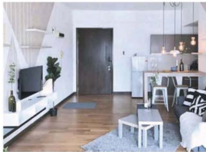
在2017年,有260万的游客使用爱彼迎服务在我国旅游。