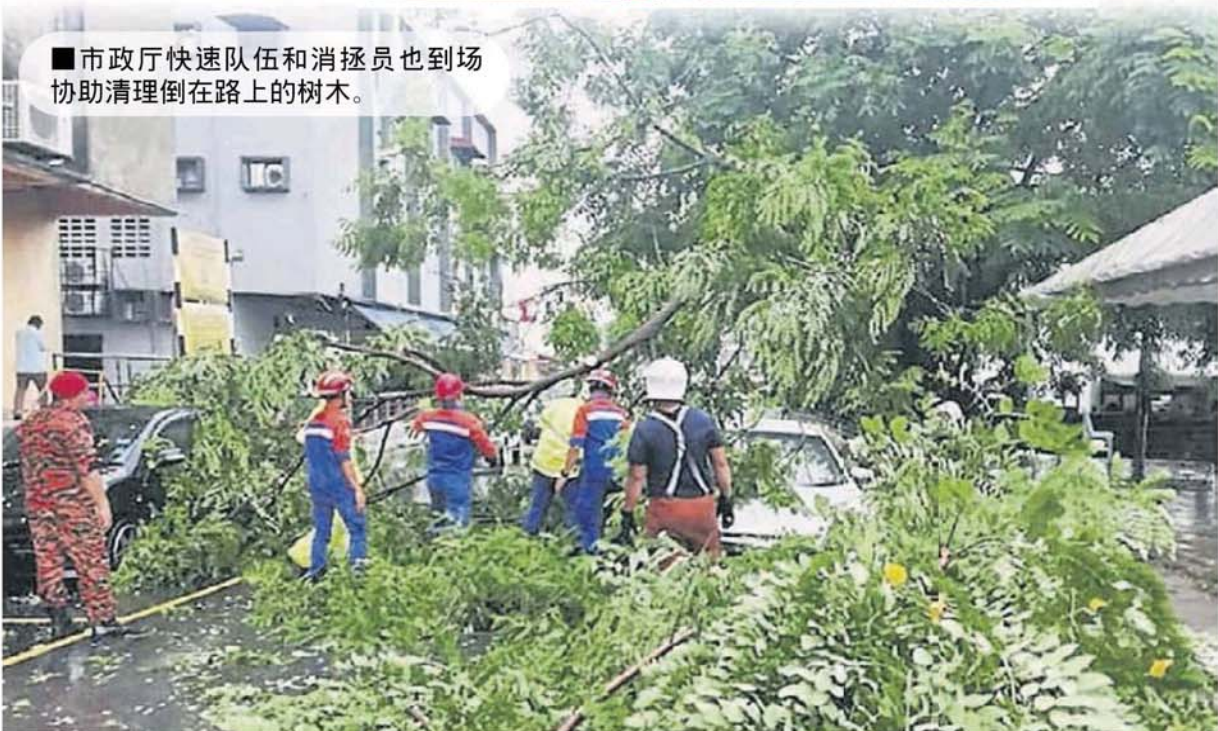
■市政厅快速队伍和消防员也到场协助清理倒在路上的树木。