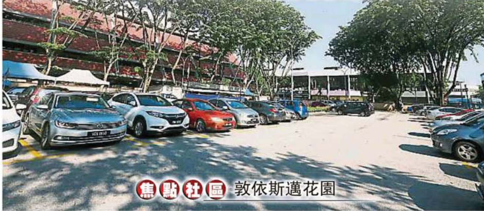
焦點社區 敦依斯邁花園

敦依斯邁花園巴剎設有室內及戶外停車場，一共有180個停車位，惟在私人公司管理下却將大部分停車位出租給外人。