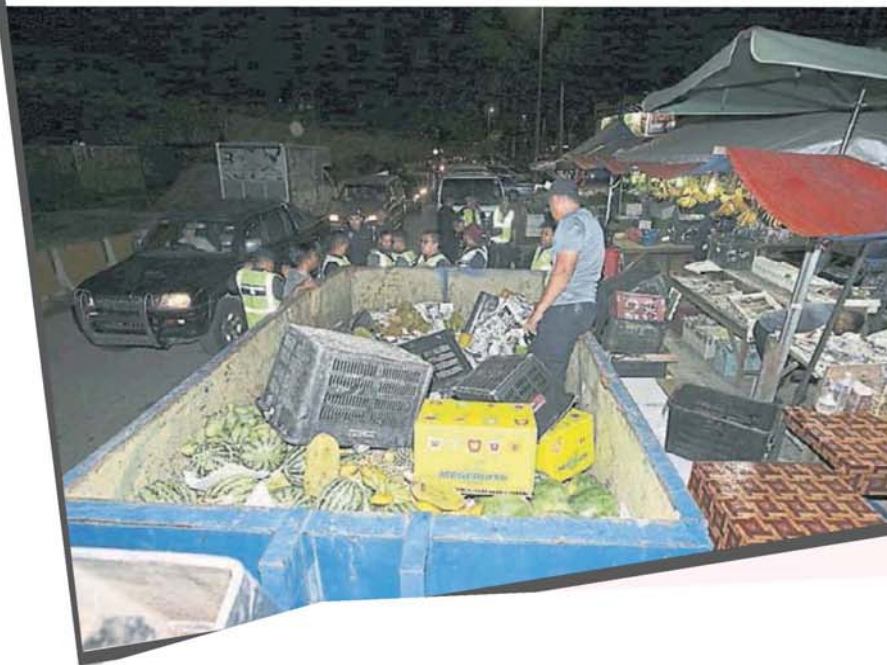
■被取缔的摊位货物众多，塞满一辆罗厘。