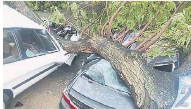
■重被压毁。 粗大的树干，让车辆也严重