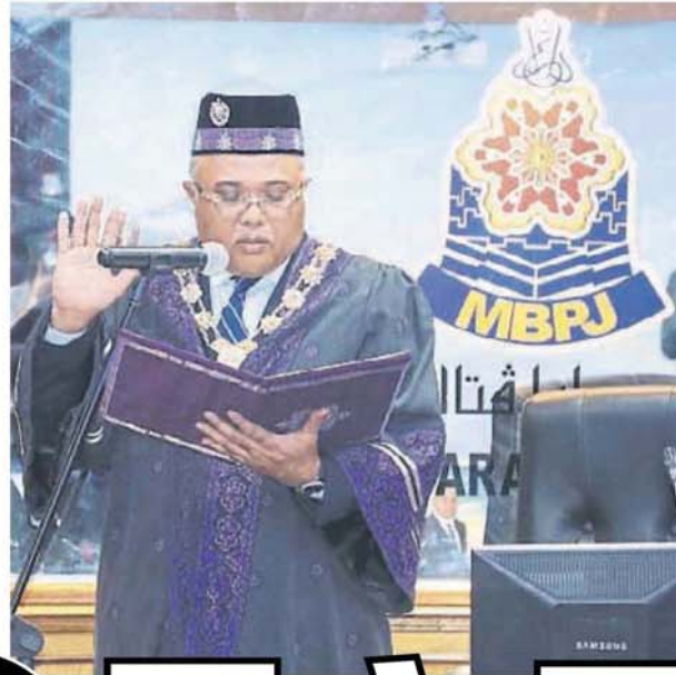
沙尤迪仔众市议员的见证下，宣誓上任为市长。