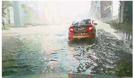
Eko Cheras广场前的蕉赖路出现严重积水，仅剩一条车道可通车，导致该路交通严重瘫痪。

另外，消防局也接获蕉赖商业区卡卡路、安宁镇小贩中心、友力花园克东巴路及蕉赖美达花园等地方有树倒投报，该局也在短时间内前往现场，分工合作将倒下的大树移走。同时，部分树倒地点也出现汽车压毁事件。