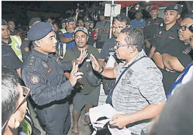
业者与官员争执，声称本身没有违法。