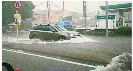
蕉赖斯嘉镇部分道路出现积水，汽车涉水而过。