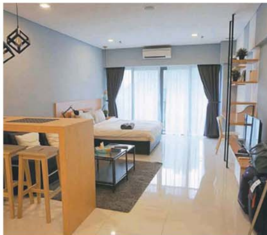
通过爱彼迎提供的住宿因不受相关法规约束。(示意图)