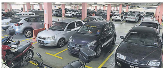
敦依斯迈花园停车场交由小贩公会管理后，增加了 24 个停车位。

她指出，吉隆坡市长之前曾在梳邦再也市议会担任主席，并把市议会打理得非常好，相信他有能力将在梳邦再也的成就也延续到吉隆坡。