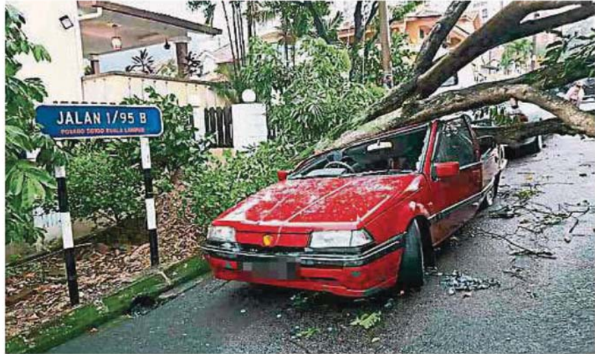
泊在路旁的汽车。友力花园1/95 B路一棵大树倒下，压毁一辆停