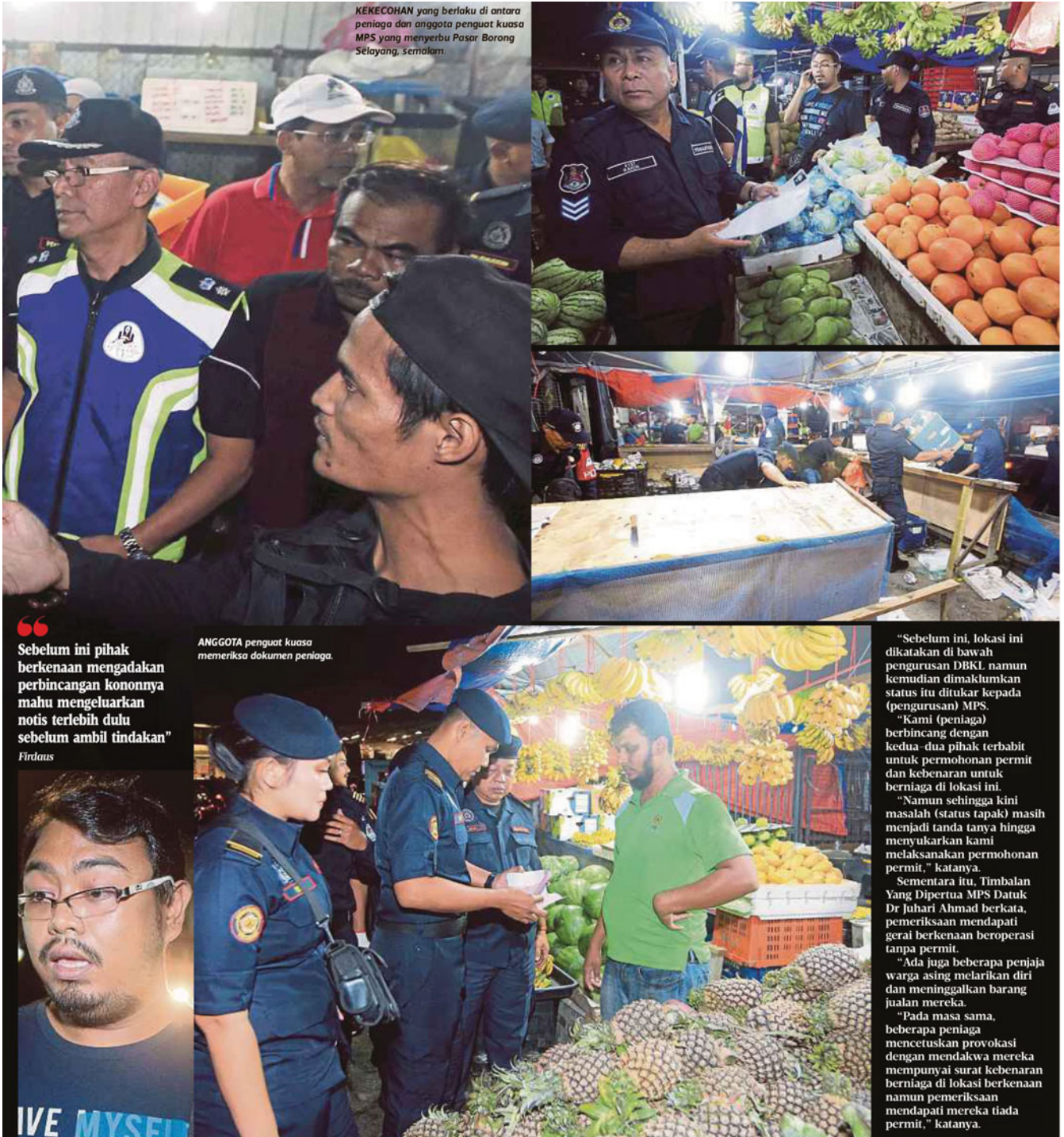
KEKECOHAN yang berlaku di antara peniaga dan anggota penguat kuasa MPS yang menyebu Pasar Borong Selayang, semalam.

“Sebelum ini pihak berkenaan mengadakan perbincangan kononnya mahu mengeluarkan notis terlebih dulu sebelum ambil tindakan” Firdaus