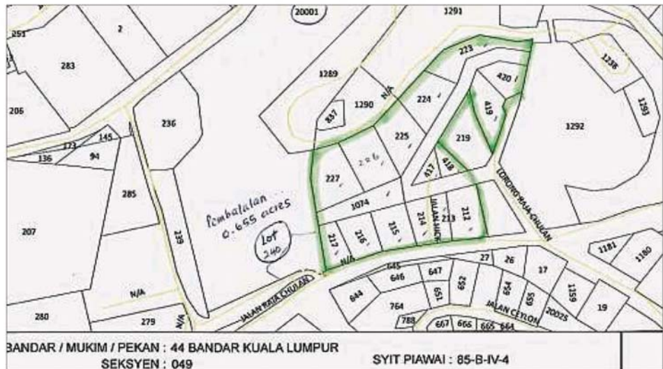
《星报》在3月的报道指出,吉隆坡市政局将向私人地主购回已申请进行发展的咖啡山森林保留地其中0.27公顷地段。

她指出,行动党武吉免登国会议员方贵伦曾质疑吉隆坡市政局直接将土地以贱价出售给私人发展商,而不是通过公开招标,并在有关过程中损失数十亿令吉,那么有关交易是否是依照公平原则下进行。