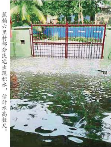
蕉赖六里村部分民宅出现积水，估计水高数尺。