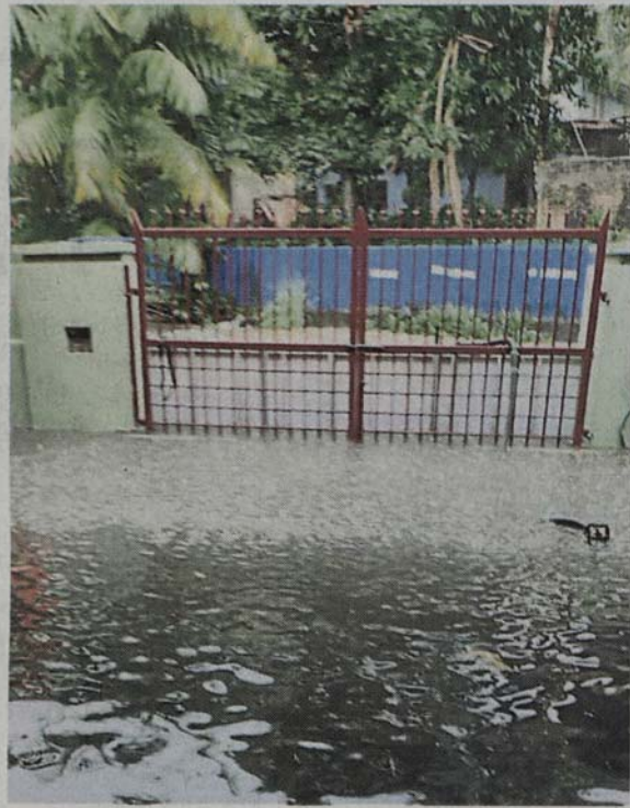
■蕉赖六里村住家出现积水情况，估计水高数尺。

此外，消防局也接获蕉赖商业区卡卡路、安宁镇小贩中心、友力花园克东巴路及蕉赖美达花园等地发生倒树及压毁车辆事件的投报，而该局也在短时间内前往现场，把倒下的大树移走。