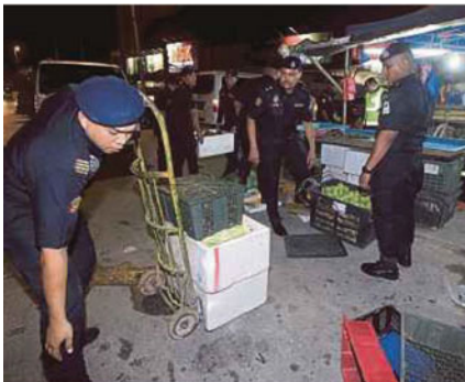
ANGGOTA penguat kuasa merampas barang jualan peniaga.