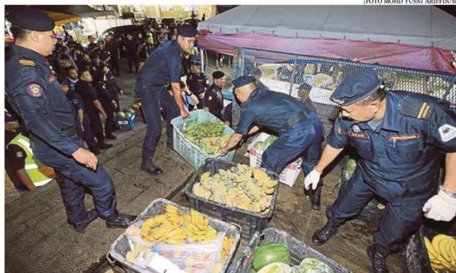
Pegawai MPS bersama Pegawai DBKL memungkah barang jualan yang dirampas sekitar Pasar Borong Selayang, malam kelmarin.