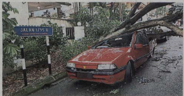
■友力花园1/95B路一棵大树倒下，压毁一辆停泊在路旁的汽车。