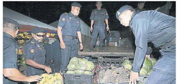
市议会官员把充公的货物搬上罗里运走。