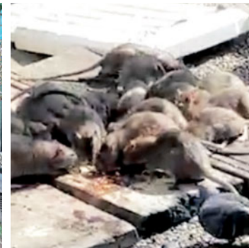
Ancaman tikus tanah yang dibangkitkan penduduk Sutra 1 yang didakwa berlarutan sejak lebih 10 tahun.

aliran air dapat berjalan sempurna," katanya,