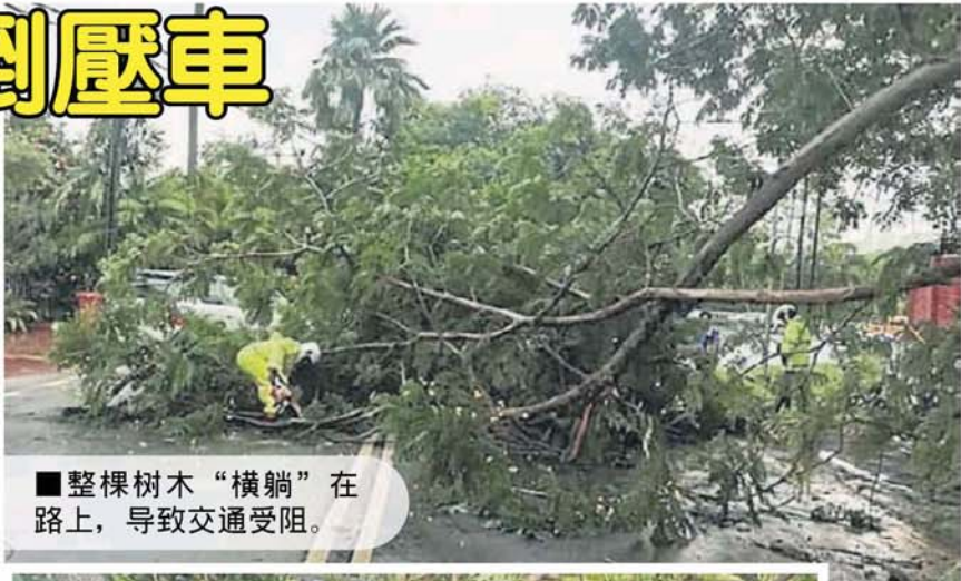
■整棵树木“横躺”在路上，导致交通受阻。

倒下的树木压到停泊在路旁的车辆，因其中一些树木非常粗壮，也导致一些车辆压毁的情况也相当的严重。