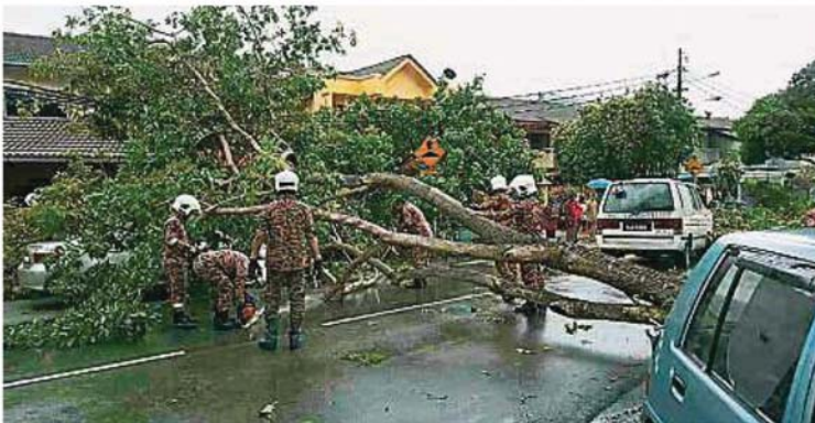
友力花园克东巴路出现树倒情况，消防员接获投报后赶至现场，将大树移走。