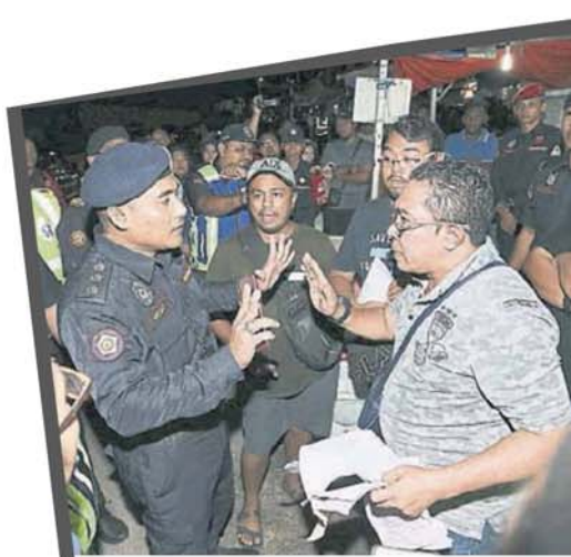
■业者与官员争执，声称本身没有违法。